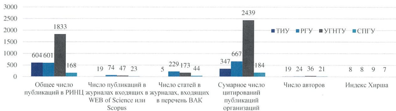
Рис.2 Наукометрические показатели оценки публикационной активности (информационные технологии нефтегазовой отрасли)

В рамках публикационной стратегии определено ежегодное количество публикаций, которое позволит ТИУ войти в сообщество ведущих университетов Российской Федерации. Также к 2030 году предусмотрено продвижение издаваемых ТИУ трех научных журналов в перечень рецензируемых научных изданий категории К1 и К2.